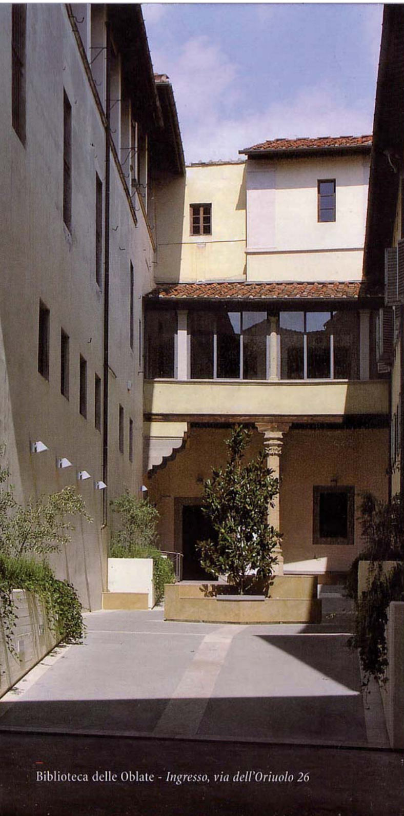
Biblioteca delle Oblate - Ingresso, via dell'Oriuolo 26