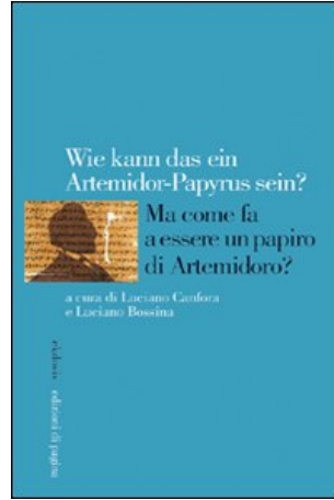
Ma come fa ad essere un papiro di Artemidoro? (Pagina, 2008)