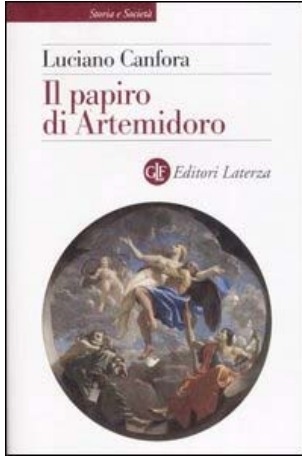
Il papiro di Artemidoro (Laterza, 2008)