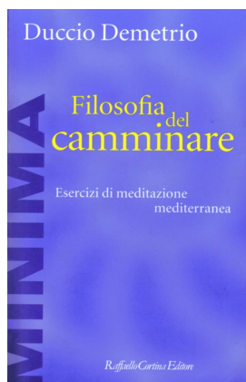
Duccio Demetrio Filosofia del camminare Esercizi di meditazione mediterranea (Raffaello Cortina, 2005)

Biblioteca Comunale Centrale - Via S. Egidio 21 - Firenze