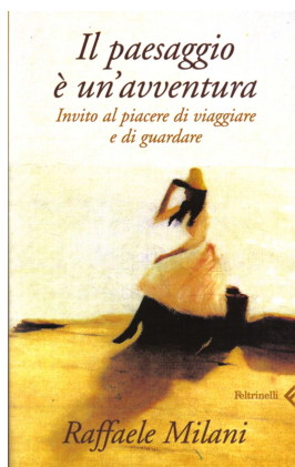
Raffaele Milani Il paesaggio è un'avventura Invito al piacere di viaggiare e di guardare (Feltrinelli, 2005)