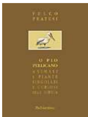
Fulco Pratesi O pio pellicano. Animali e piante singolari e curiosi della Bibbia (Rubbettino, 2005)