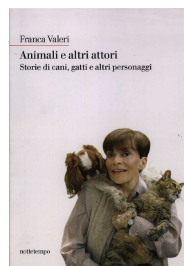
Franca Valeri Animali e altri attori. Storie di cani, gatti e altri personaggi (Nottetempo, 2005)