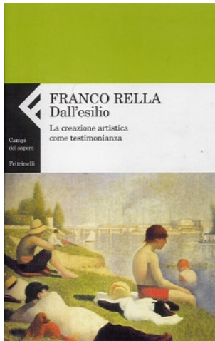
Dall'esilio La creazione artistica come testimonianza (Feltrinelli, 2004)