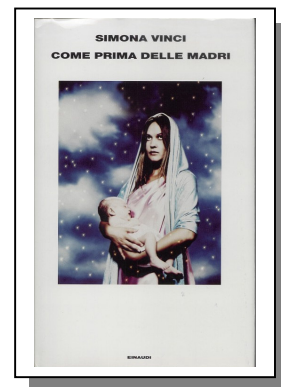
Come prima delle madri (Einaudi, 2003)